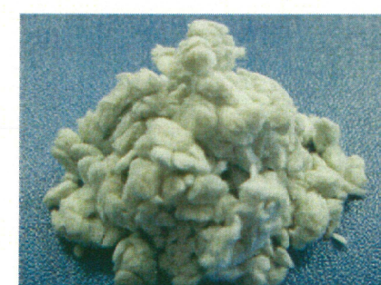
CF50(繊維長500 μ m)