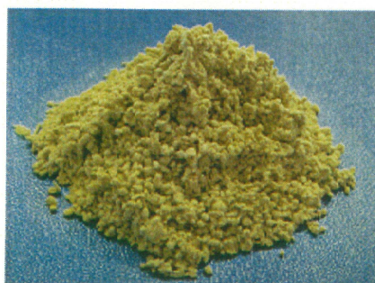
RF825-Roxul1000(繊維長150 μ m)