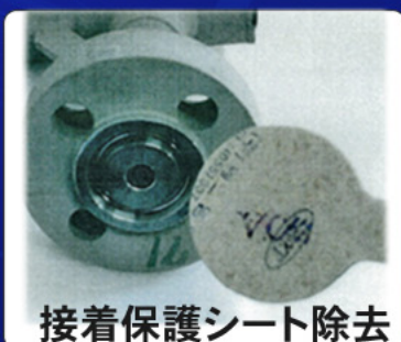
接着保護シート除去 パイプ端部