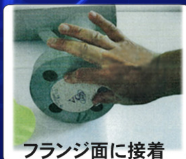
フランジ面に接着