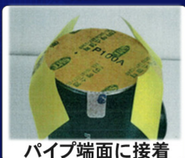
パイプ端面に接着