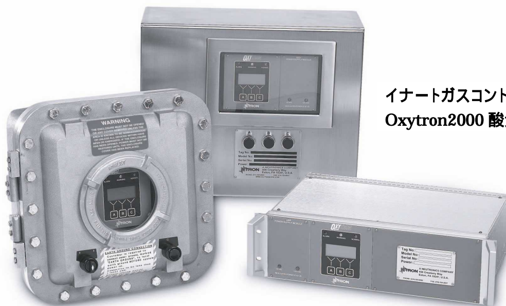
イナータガスコントロールシステム用 Oxytron2000 酸素分析計シリーズ