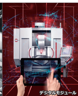
デジタルモジュール