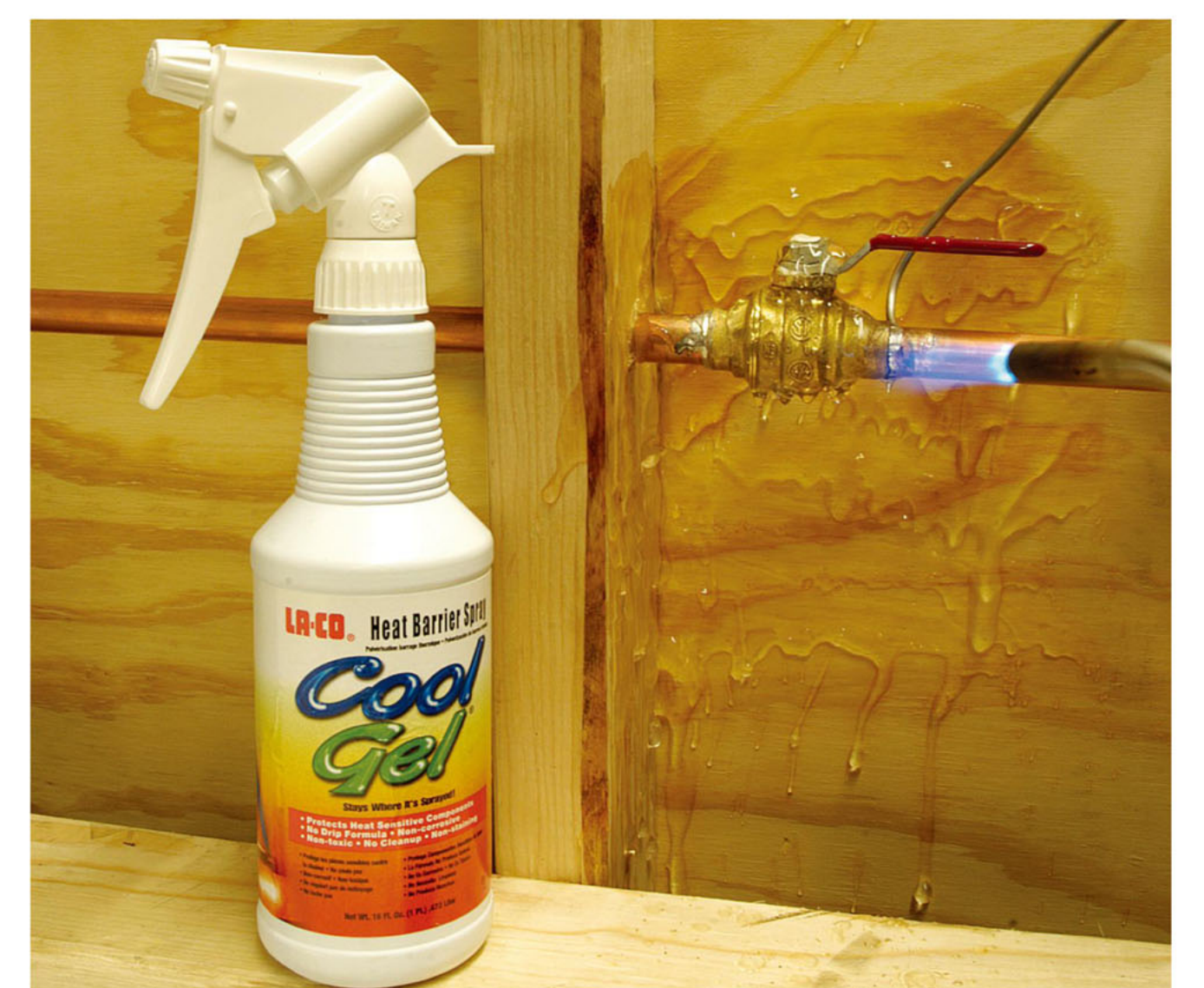
Cool Gel 使用