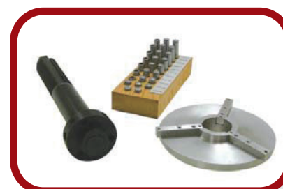
オプションの3爪 インディペンデントマンドレル