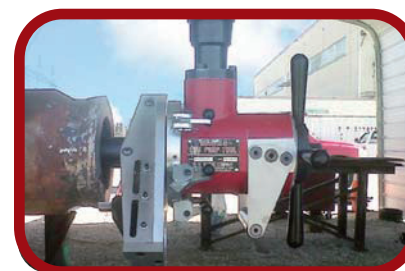
FFキット(オプション)