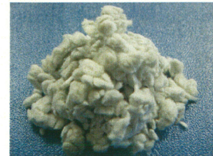
CF50(繊維長500 \mu m)