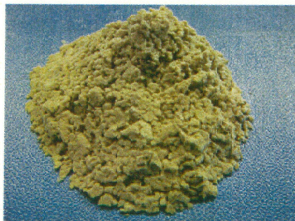
MS603-Roxul1000(繊維長125 \mu m)