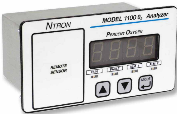
MODEL : OMS-1100 O 2