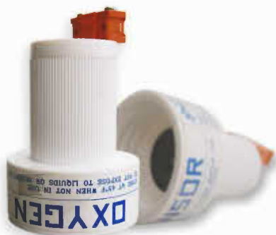
MODEL : OXYGEN SENSOR