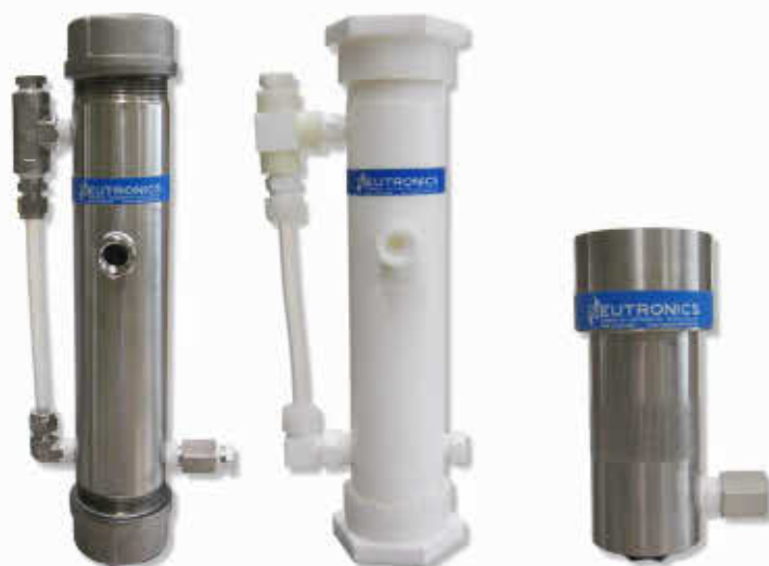
■ オートドレイン (SUS 316)