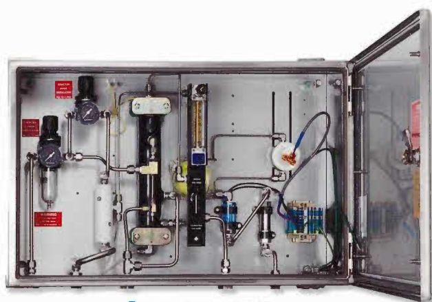
■ サンプルング設備