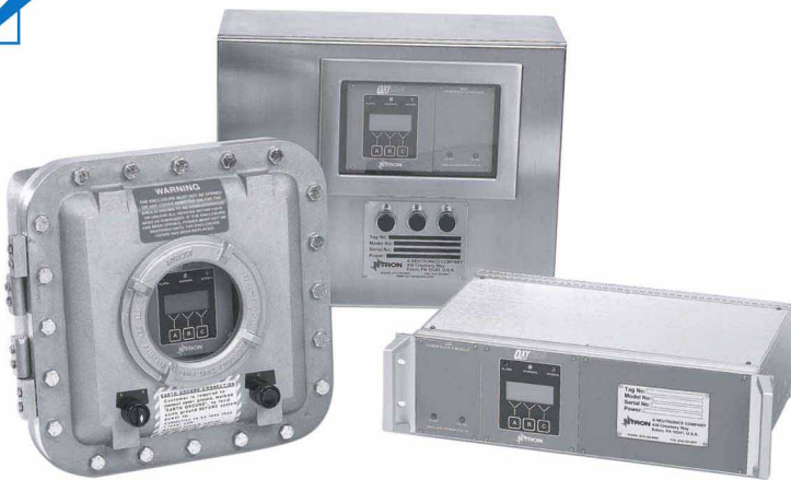
MODEL : ICS Oxytron2000